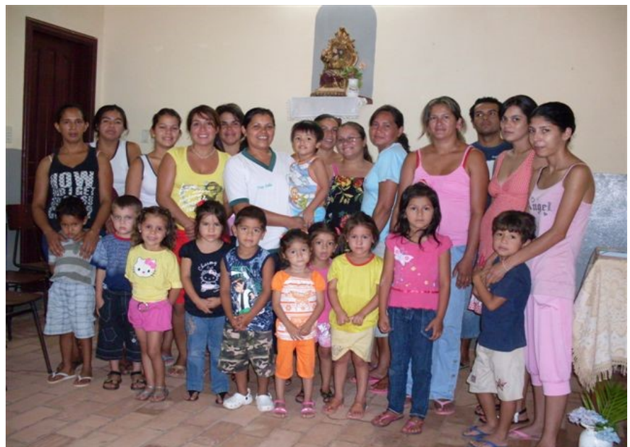
Niños de madres recicladoras