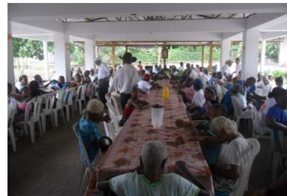
Ancianato Tumaco- Colombia