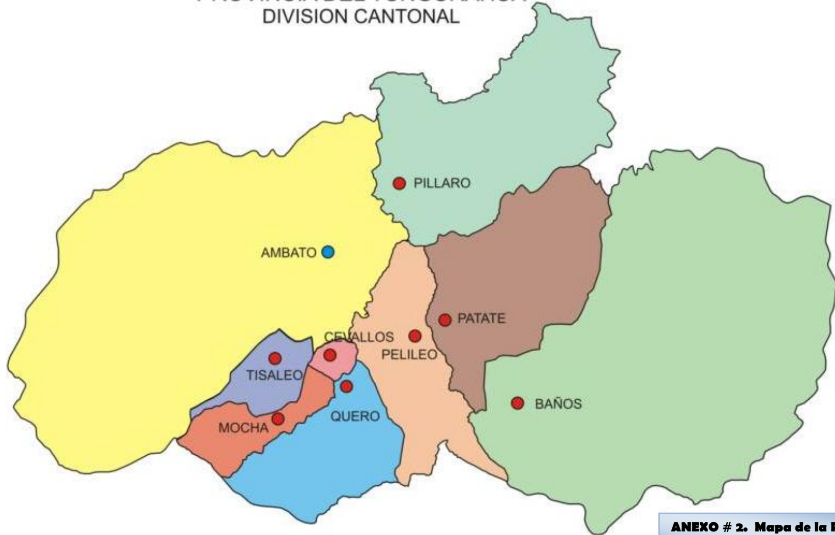
ANEXO # 2. Mapa de la Provincia del Tungurahua y sus Cantones