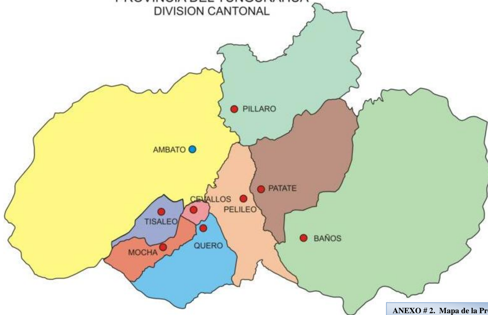
ANEXO # 2. Mapa de la Provincia del Tungurahua y sus Cantones